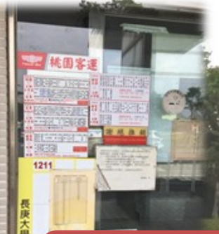
也是定期公車候車處