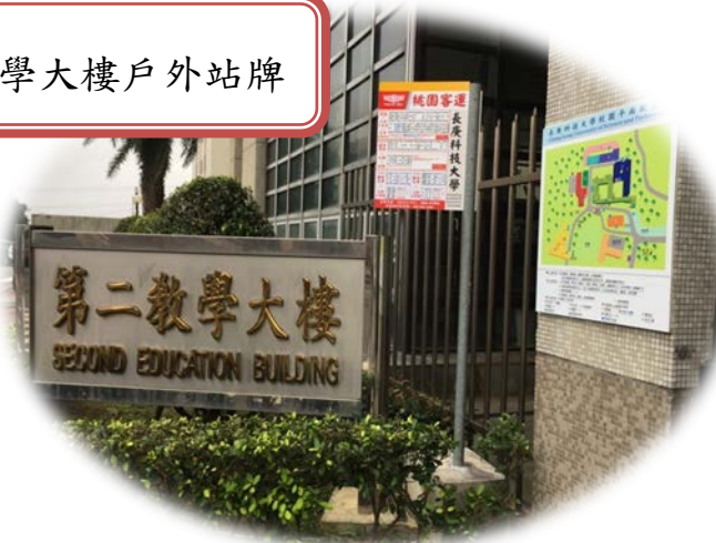
第二教學大樓戶外站牌